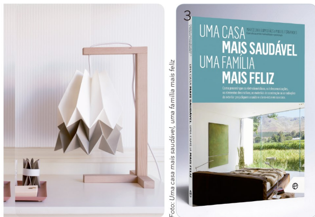
Foto: Uma casa mais saudável, uma família mais feliz